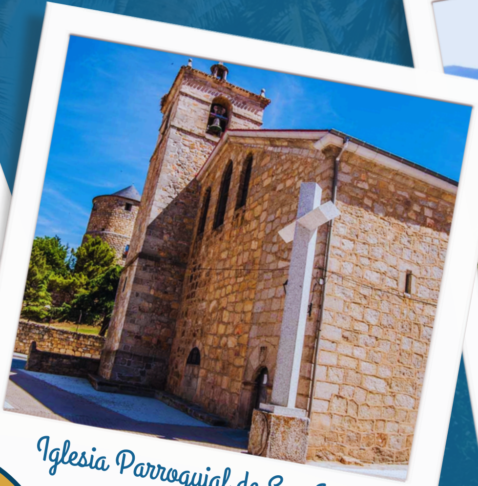
Iglesia Parroquial de San Juan Bautista.