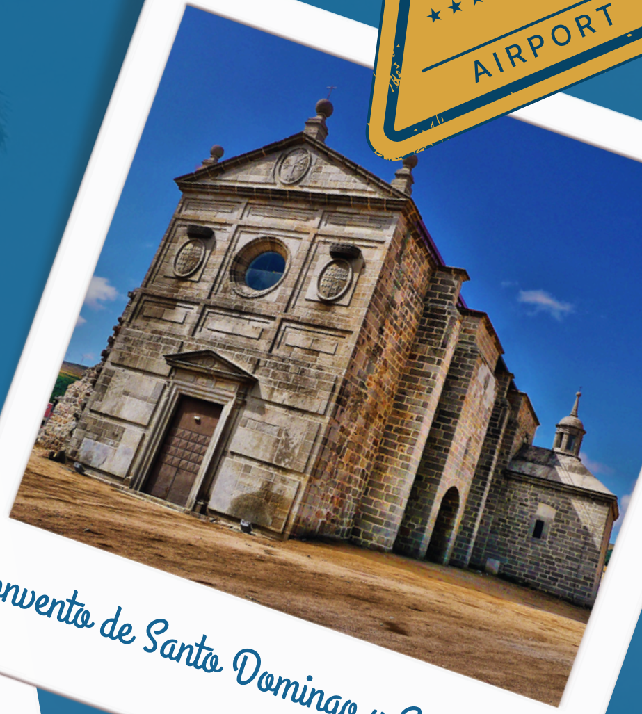
Convento de Santo Domingo y San Pablo.