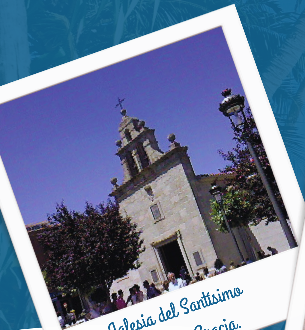
Iglesia del Santísimo Cristo de Gracia.